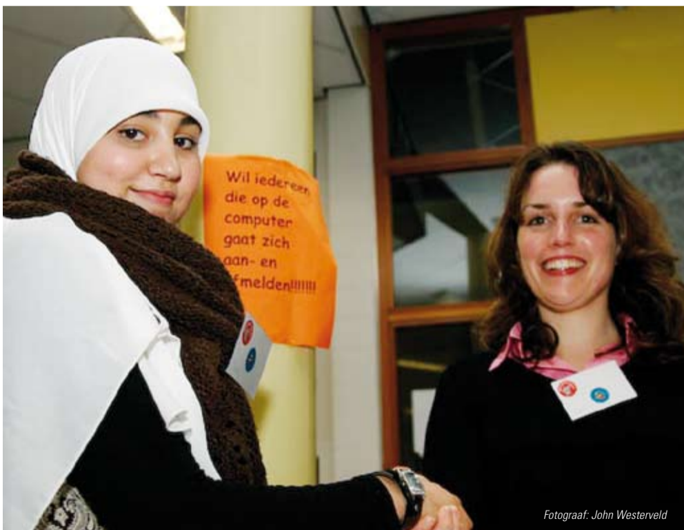
Coach en coachee bij de start van Coach4Talent.

“Ik weet nu welke richting ik op wil”. “Coaching verruimt mijn blik”. Zomaar een greep uit de reacties van leerlingen en coaches die meedoen aan het nieuwe project van de Taskforce MBO van de provincie Utrecht: Coach4Talent. Leerlingen van ROC Midden Nederland en ROC ASA krijgen hierbij een half jaar één op één coaching van een manager uit het bedrijfsleven met als doel voortijdige schooluitval te voorkomen. Deze duurzame vorm van Maatschappelijk Betrokken Ondernemen heeft voor beide partijen voordelen: de leerling krijgt extra aandacht en wordt gestimuleerd om zijn kansen op de arbeidsmarkt te vergroten, de coach werkt aan zijn persoonlijke ontwikkeling en krijgt meer inzicht in de multiculturele samenleving. Deelnemende partners zijn de provincie Utrecht, ROC Midden Nederland, ROC ASA, Fortis, Mitros, Ordina, Rabobank en KPMG.